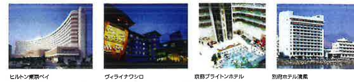
ヒルトン東京ベイ ヴィライナワシロ 京都プライトンホテル 別府ホテル温泉 ※上記の対象施設は一例です。ご利用方法につきましては、会員様専用ホームページにてご確認ください。